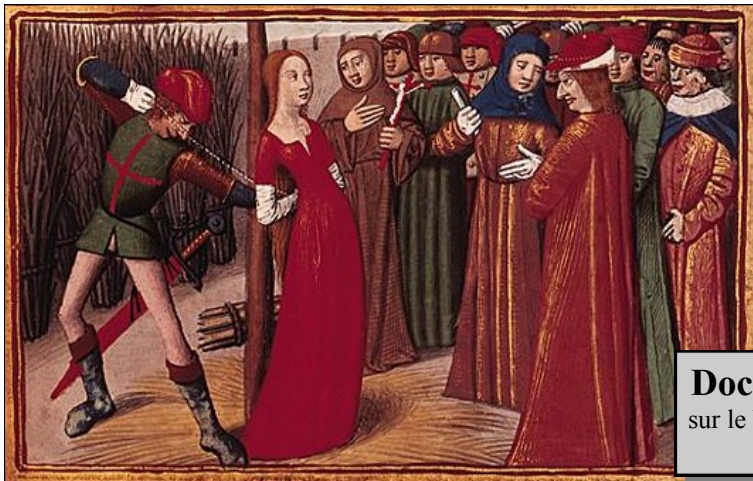
Document 10 : Jeanne d'Arc sur le bûcher en 1431 - enluminure - XV e (15 e ) siècle - Bnf