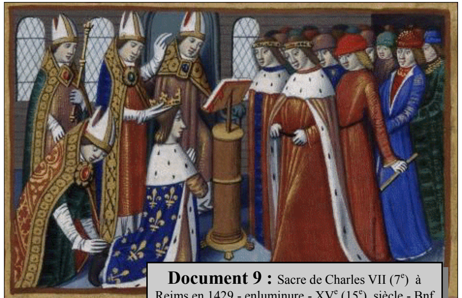
Document 9 : Sacre de Charles VII (7 e ) à Reims en 1429 - enluminure - XV e (15 e ) siècle - Bnf