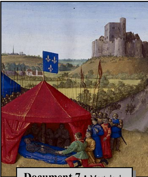
Document 7 : Mort de du Guesclin en 1380 - enluminure de Fouquet - XV e (15 e ) siècle - Bnf

mai 2006 dernières modifications en juillet 2014